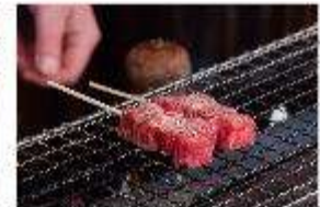
รูปประทานอาหารกลางวัน ณ ภัตตาคาร