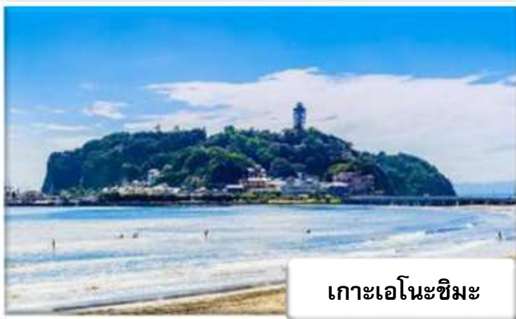
เกาะเอโนะชิมะ

เกาะเอโนะชิมะ (Enoshima) นั้นเป็นเกาะที่ลอยอยู่กลางทะเลอยู่ในเขตโชนันของจังหวัดคานากาวา เป็นสถานที่ที่แหล่งท่องเที่ยวมากมายมารวมตัวกันอยู่ ทั้งทิวทัศน์อันงดงาม ศาลเจ้า ปรภคาร ถ้ำและอื่น ๆ อีกทั้งเมนูอาหารทะเลยังเป็นของอร่อยชื่อดังของที่นี่