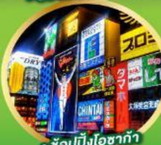
• ช้อปปิ้งโอซาก้า

• ชมความงามของกำแพงหิมะ เส้นทางสายอัลไพน์ทาเทยาม่า (Japan Alps Snow wall)