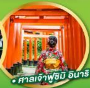
• ศาลเจ้าฟูชิมิ อินาริ

ลดพิเศษ 3,000 เหลือ 24-30 เม.ย. 68 62,900.- 06-12 พ.ค. 68 65,900.- ราคา