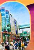
ย่านเทนจิน