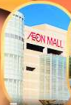
อีออนมอลล์