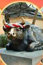
ศาลเจ้าดาโชฟู