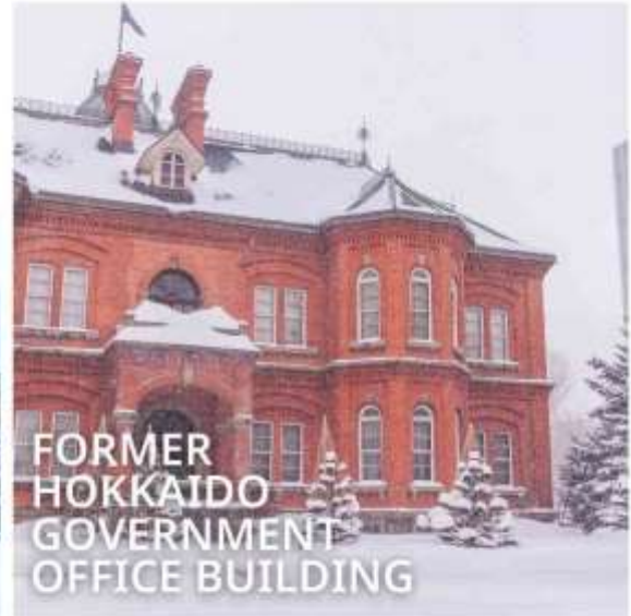
FORMER HOKKAIDO GOVERNMENT OFFICE BUILDING