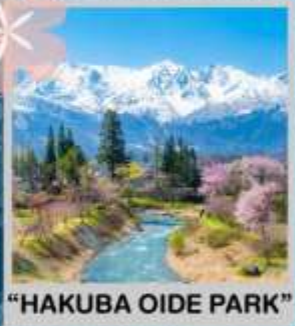
"HAKUBA OIDE PARK"