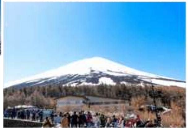
รูปนี้คือรูปประกอบการใช้สถานที่