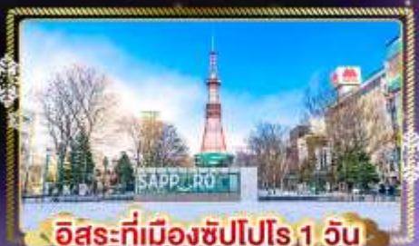
อิสระที่เมืองซัปโปโร 1 วัน