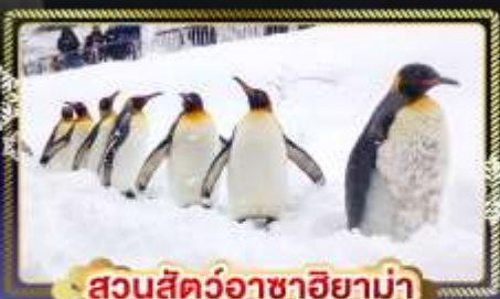
สวนสัตว์อาซาฮิยาม่า