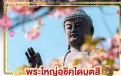
พระใหญ่อุซึคุโดบุตสึ