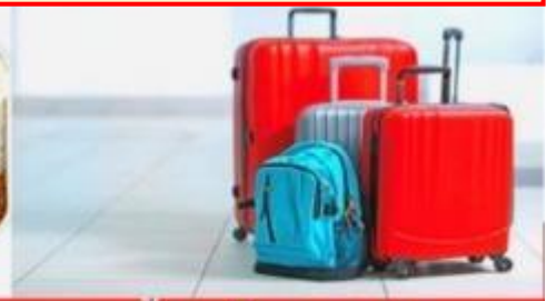
น้ำหนักกระเป๋า สูงสุด 20 กก.

10:45 เดินทางถึง สนามบินนานาชาตินาริตะ ประเทศญี่ปุ่นดินแดนอาทิตย์อุทัย หลังผ่านพิธีศุลกากรและตรวจ คนเข้าเมืองพร้อมรับสัมภาระเรียบร้อยแล้ว นำท่านเดินทางสู่