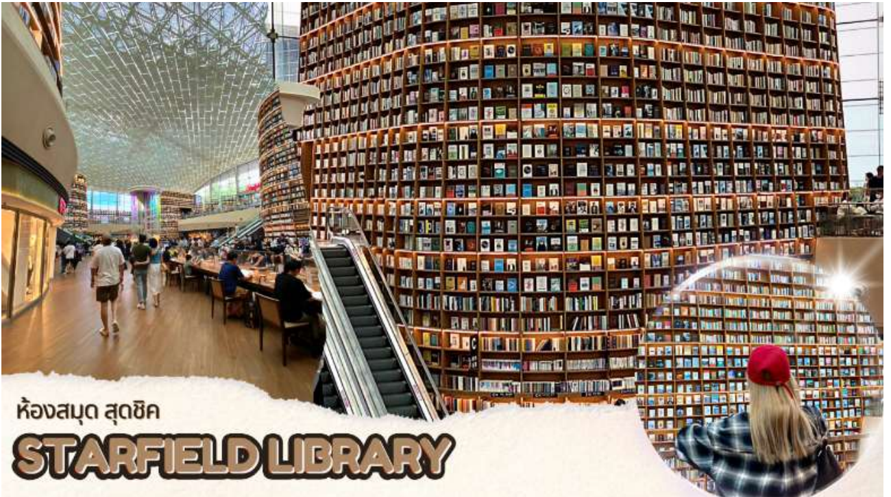
ห้องสมุด สุดชิค STARFIELD LIBRARY

นำท่านไปที่ Star field Library ซึ่งที่ตั้งอยู่ในห้าง โคเอ็กซ์(Coex) เป็นที่เที่ยวถ่ายรูปสุดชิคแห่งใหม่ ของกรุงโซลที่เพิ่งเปิดได้ไม่นาน ที่นี่มีการออกแบบตกแต่งที่สวยงามแปลกตา ไม่น่าเบื่ออย่างที่เรามักจะนึกภาพห้องสมุดกัน อยู่ไม่ไกลจากใจกลางกรุงโซลมากนัก ใกล้ๆกับย่านกังนัม และวัดบงอินซา(Bongeunsa Temple)ที่เป็นวัดตั้งที่สุดแห่งหนึ่งของกรุงโซล ห้าง Coex ก็มีขนาดค่อนข้างใหญ่ภายในห้างมีแบรนด์เสื้อผ้า ของกิน ของใช้ต่างๆให้เลือกมากมาย