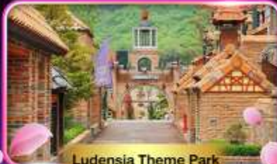
Ludensia Theme Park