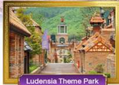
Ludensia Theme Park

• เมนูพิเศษ! บึงย่างเกาหลี, Seafood Hotpot, จิมกัก