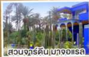
สวนจาร์ดิน|มาจออเรล

เดินทาง 14-23 มี.ค. 68 23 เม.ย.-02 พ.ค. 68 02-11 พ.ค. 68