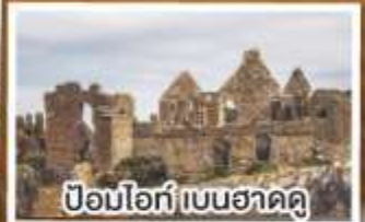
ป้อมโอ๊ก์ เบนฮาดดู