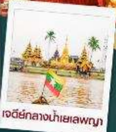
เจดีย์กลางน้ำเยเลพญา