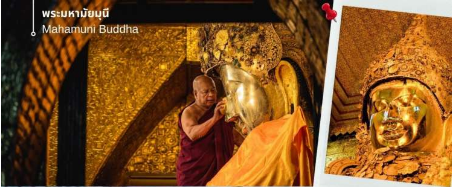
พระมหามัญนี่ Mahamuni Buddha

นำท่านเดินทางสู่ เมืองสกายน์ หรือชะไก้ (Sagaing) ตั้งอยู่บนฝั่งขวาของแม่น้ำอิรวดี ตรงข้ามกับเมืองอังวะ เมืองชะไก้มีวัดทางพุทธศาสนาที่สำคัญหลายแห่ง เมืองสร้างขึ้นตั้งแต่คริสต์ศตวรรษที่ 14 เพื่อเป็นเมืองหลวงของอาณาจักรชะไก้ ซึ่งเป็นหนึ่ง