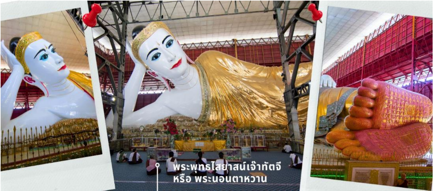
พระพุทธไสยาสน์เจ้ากัตจี หรือ พระนอนตาหวาน

นำท่านสักการะ พระพุทธไสยาสน์เจ้ากัตจี หรือ พระนอนตาหวาน ซึ่งเป็นพระพุทธรูปไสยาสน์องค์ขนาดใหญ่ที่มีความสูงถึง 6 ชั้น ยาวกว่า 70 เมตร ใช้โครงเหล็กกันถึง 65 เมตร มีหลังคาคลุม 6 ชั้น สร้างขึ้นเมื่อปี 1907 ถูกยกย่องให้เป็นพระนอนที่มีขนาดใหญ่และงดงามที่สุดในพม่า ด้วยพระพักตร์ที่งดงามเปี่ยมยิ้ม ดวงตาทำจากลูกแก้วที่ส่งผลิตจากต่างประเทศ ทาขอบตาด้วยสีฟ้าและมีขนตาหนายาวทำให้ดวงตาดูหวาน จนถูกเรียกพระนามอีกชื่อคือ “พระตาหวาน” บริเวณพระบาทมีภาพวาดลายธรรมจักร ตรงกลางฝ่าพระบาทล้อมรอบด้วยรูปมงคล 108 ประการ ที่แสดงถึงอากาศโลก สัตว์โลก และสังขารโลก อีกทั้งจิวยังมีลักษณะผิวขาวสมจริงและตรงชายประดับด้วยอัญมณีแวววาว ถือเป็นพุทธศิลป์ที่มีความงดงามทรงคุณค่า