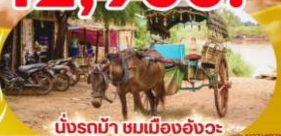
นั่งรถม้า ชมเมืองอังวะ

อาหาร 6 มื้อ น้ำหนัก 30 KG ระดับ 4 ดาว รวมประกันการเดินทาง สนามบินดอนเมือง