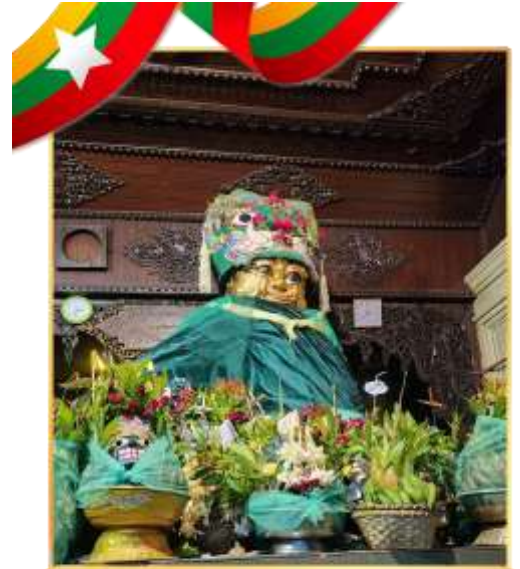
พามู “แม่ยักษ์” ตัดกรรม

พามู “แม่ยักษ์” คนพม่าเชื่อว่าแม่ยักษ์จะช่วยในการตัดกรรมจากเจ้ากรรมนายเวร ให้ชีวิตของคุณมีแต่ดีขึ้นเรื่อยๆ และยังช่วยเรื่องความมีชื่อเสียงโด่งดัง เป็นที่รู้จักในหน้าที่การงาน*