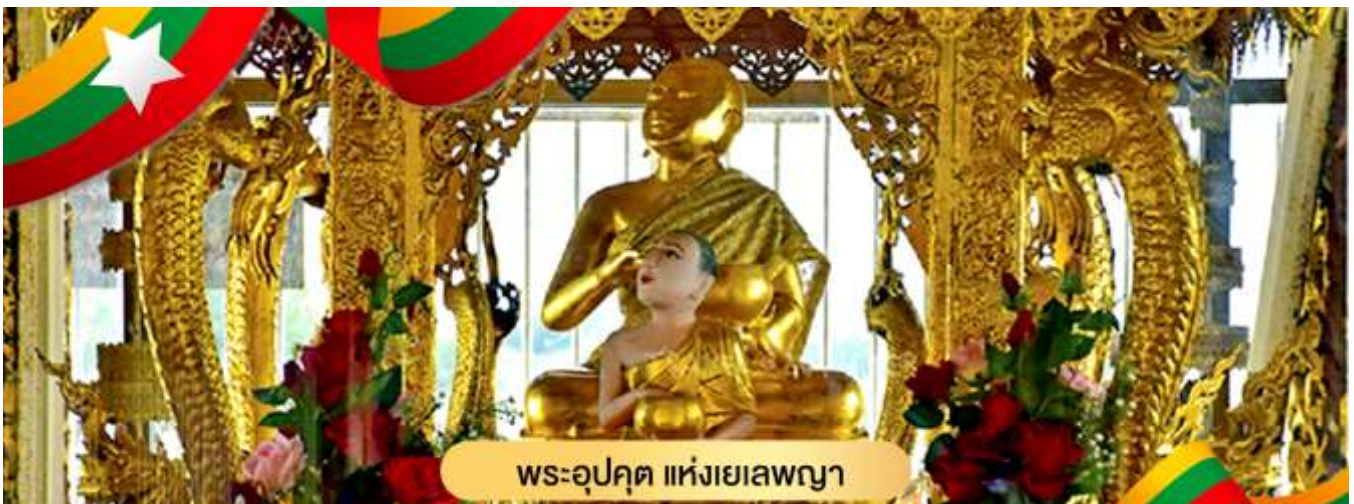
พระอุปคุต แห่งเยเลพญา

นำท่านไหว้สักการะเพื่อขอพร พระจกบาตร หรือพระคุปคุต ที่เป็นที่นับถือของชาวพม่า สามารถซื้ออาหารเลี้ยงปลาตุ๊กตัวใหญ่นับพัน ที่ว่ายวนเวียนให้เห็นครีบหลังที่โผล่เหนือผิวน้ำ