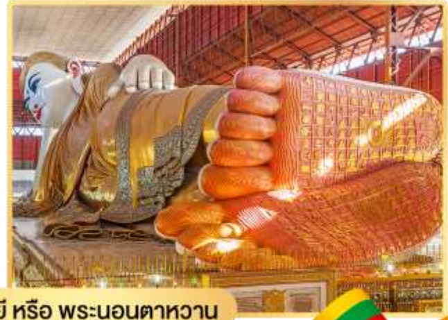
พระพุทธรูปไสยาสน์เจ้ากัตยี หรือ พระนอนตาทหวาน

นำท่านสักการะ พระพุทธรูปไสยาสน์เจ้ากัตยี (Kyauk Htatgyi Buddha) หรือ พระนอนตาทหวาน นมัสการพระพุทธรูปนอนที่มีความยาว 55 ฟุต สูง 16 ฟุต ซึ่งเป็นพระที่มีความสวยที่สุดมีขนตาที่งดงาม พระบาทมีภาพมงคล 108 ประการ และพระบาทซ้อนกันซึ่งแตกต่างกับศิลปะของไทย