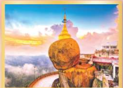
สักการะ พระธาตุนครอินทร์แขวน