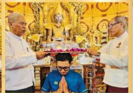
ร่วมพิธีเท็นพระธาตุนคร เจดีย์กาบาเอ