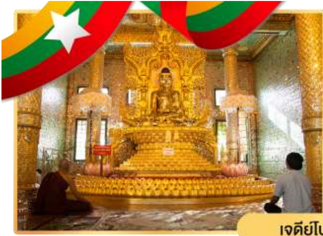
เจดีย์โบตาทาวน์