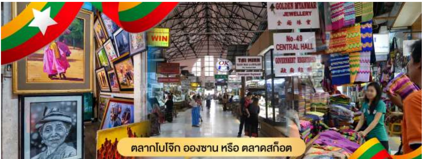
ตลาดโบโจ๊ก อองซาน หรือ ตลาดสก๊อต

นำท่านสักการะ พระพุทธรูปไสยาสน์เจ้ากัตยี (Kyauk Htatgyi Buddha) หรือ พระนอนตาทหวาน นมัสการพระพุทธรูปนอนที่มีความยาว 55 ฟุต สูง 16 ฟุต ซึ่งเป็นพระที่มีความสวยที่สุดมีขนตาที่งดงาม พระบาทมีภาพมงคล 108 ประการ และพระบาทซ้อนกันซึ่งแตกต่างกับศิลปะของไทย