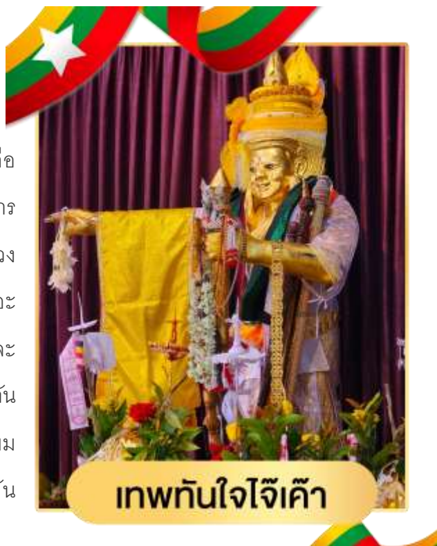
เทพทันใจใจใจเค้า

ถือได้ว่าเป็นเจดีย์คู่บ้านคู่เมืองของสิริเยม และยัง มีเทพทันใจใจใจเข้าซึ่งบอกเลยว่าองค์นี้แหละค่ะคือ หัวหน้าเทพทันใจในย่างกุ้งอย่างแท้จริง เพราะที่การ จะสร้างเทพทันใจขึ้นมาใหม่นั้นจะต้องมาบวงสรวง ขออนุญาตที่นี้ก่อน ใครที่อยากได้งานใหญ่ เงินเยอะ ให้มาสักการะเทพทันใจใจใจเข้าแห่งนี้ ทั้งชาวพม่าและ ชาวไทยจึงมาไหว้ขอพรเรื่องงานและความสำเร็จกัน มากมาย โดยเฉพาะเหล่าดาราสีชื่อดังของไทยที่นิยม ไปกราบไหว้เสริมสิริมงคลเสริมชื่อเสียงบารมีกัน อย่างล้นหลาม