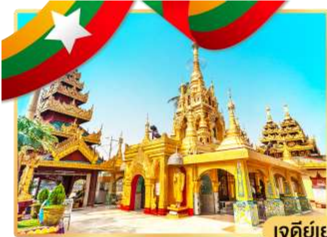
เจดีย์เยเลพญา

จากนั้นนำท่านเดินทางโดยรถโค้ชสู่ เมืองสิริเรียม ซึ่งอยู่ห่างจากกรุงย่างกุ้งประมาณ 45 กิโลเมตร เมื่อเดินทางถึงเมืองสิริเรียม ชมความงามแปลกตา ของเมือง ซึ่งเมืองนี้เคยเป็นเมืองท่าของโปรตุเกสในสมัย