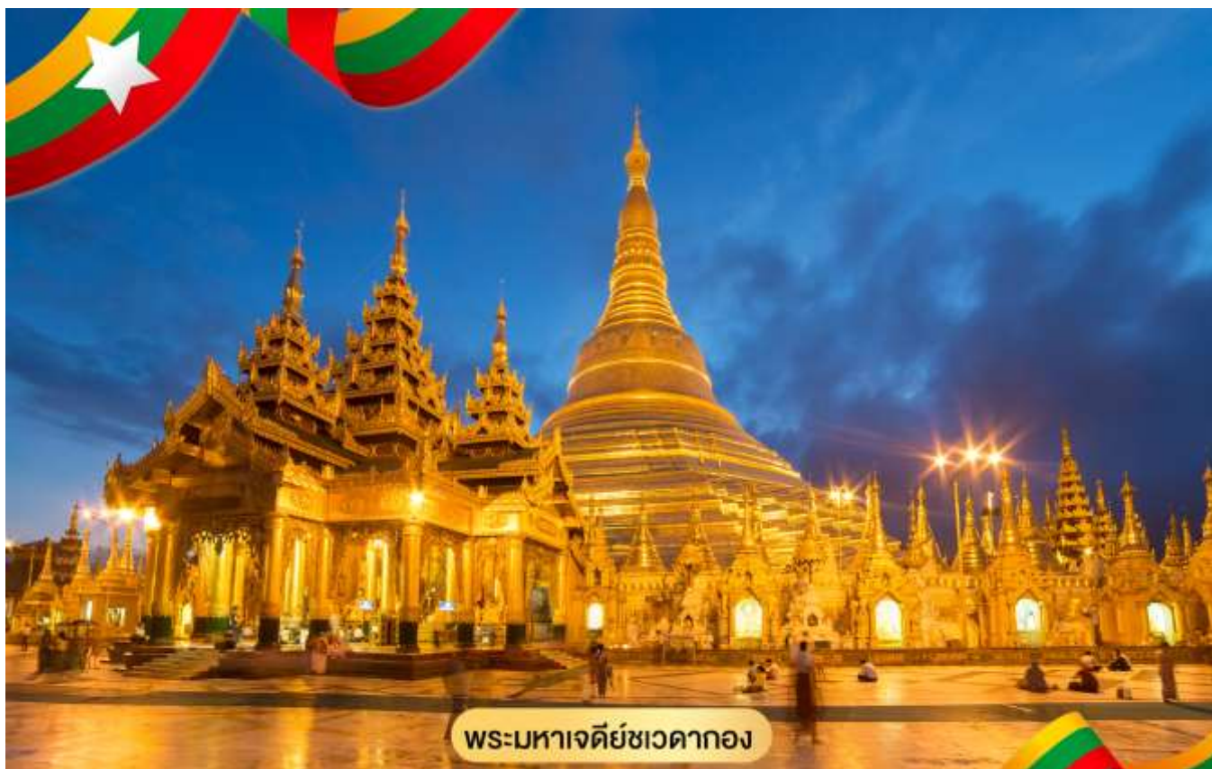
พระมหาเจดีย์ชเวดากอง

มีตำนานและภูมิหลังความเป็นมาทั้งสิ้น ชมระฆังใบใหญ่ที่อังกฤษพยายามจะเอาไปแต่เกิดพัดตกแม่น้ำ อย่างกุ่มเสียก่อนอังกฤษกู้เท่าไรก็ไม่ขึ้นภายหลังชาวพม่า ช่วยกันกู้ขึ้นมาแขวนไว้ที่เดิมได้ จึงถือเป็น สัญลักษณ์แห่งความสามัคคีซึ่งชาวพม่าถือว่าเป็นระฆังศักดิ์สิทธิ์ ให้ตีระฆัง 3 ครั้งแล้วอธิษฐานขออะไรก็ จะได้ดังต้องการ จากนั้นให้ท่านชมแสงของอัญมณีที่ประดับบนยอดฉัตรโดยจุดชมแต่ละจุดท่านจะได้เห็น แสงสีต่างกันออกไป เช่น สีเหลือง, สีน้ำเงิน, สีส้ม, สีแดง เป็นต้น