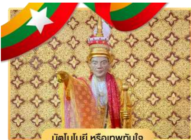
นัตโบโบยี หรือเทพทันใจ

จากนั้นนำท่านข้ามฝั่งไปอีกฟากหนึ่งของถนน เพื่อสักการะ เทพกระซิบ ซึ่งมีนามว่า “อะมาดอร์เมียร์” ตามตำนานกล่าวว่า นางเป็นธิดาของพญานาค ที่เกิดศรัทธาในพุทธศาสนาอย่างแรงกล้า รักษาศีล ไม่ยอมกินเนื้อสัตว์จนเมื่อสิ้นชีวิตไปกลายเป็นนัต ซึ่งชาวพม่าเคารพกราบไหว้กันมานานแล้ว ซึ่งการขอพรเทพ กระซิบต้องไปกระซิบเบาๆ ห้ามคนอื่นได้ยิน ชาวพม่านิยมขอพรจากเทพองค์นี้กันมากเช่นกัน การบูชาเทพ กระซิบ บูชาด้วยน้ำนม ข้าวตอก ดอกไม้ และผลไม้