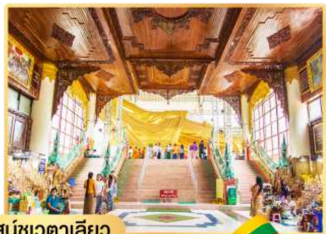
พระพุทธไสยาสน์ชเวตาลีเยว