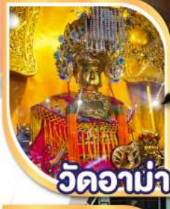
วัดอาน่า