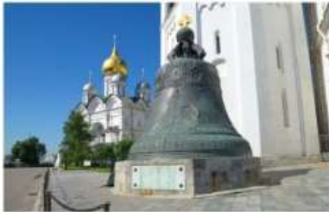
ระบั้งพระเจ้าซาร์

สร้างในสมัยพระนางแอนนาที่ทรงประสงค์จะสร้างระบั้งใบใหญ่ที่สุดในโลกเพื่อนำไปติดตั้งบนหอรบั้ง แต่เนื่องจากมีความผิดพลาดจึงทำให้ระบั้งแตกออก