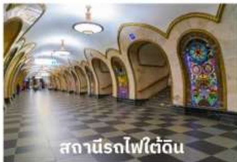
สถานีรถไฟใต้ดิน

บริการอาหารเช้า ณ ห้องอาหารของโรงแรม นำท่านเที่ยวชม สถานีรถไฟใต้ดิน ที่ใครมามอสโกจะต้องได้ลองนั่งรถไฟใต้ดินดูสักครั้ง