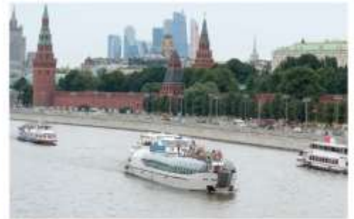
ล่องเรือแม่น้ำมอสโคว์