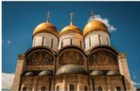
โบสถ์อัสสัมชัญ