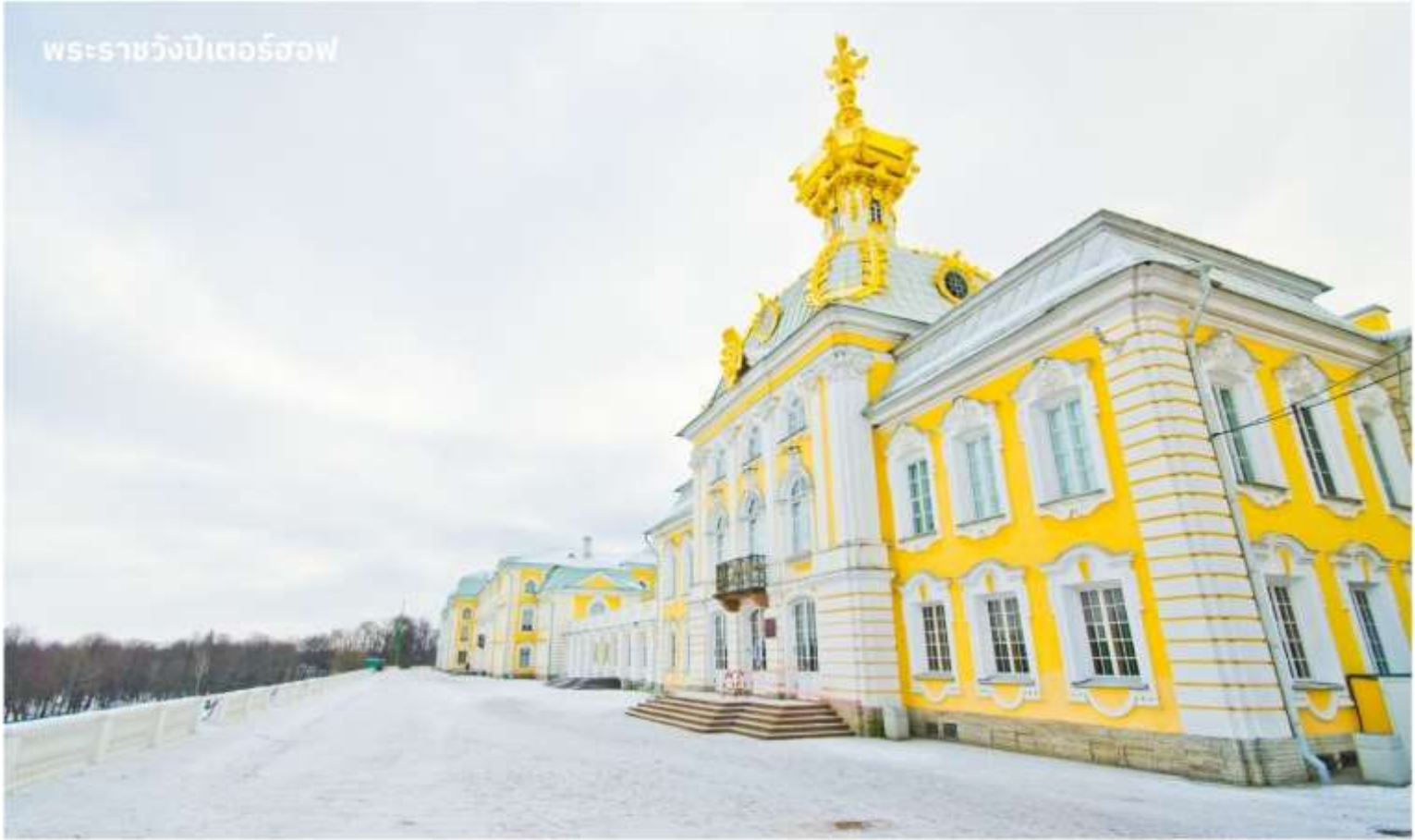
พระราชวังปีเตอร์ฮอฟ