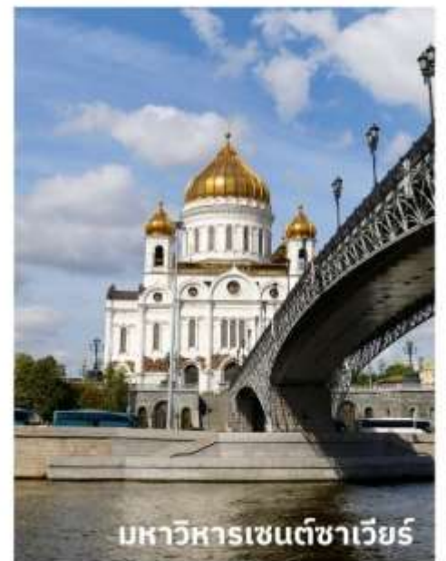
มหาวิหารเซนต์ซาเวียร์