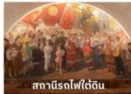
สถานีรถไฟใต้ดิน

เพราะนอกจากจะมีสถานีรถไฟใต้ดินที่สวยงามที่สุดในโลกแล้วยังมีความลึกมากอีกด้วย รถไฟใต้ดินทำให้ผู้คนสามารถเดินทางไปไหนมาไหนได้สะดวกกว่าบนถนนทั่วไป สถานีรถไฟใต้ดินเป็นสิ่งก่อสร้างที่ชาวรัสเซียสามารถอวดชาวต่างชาติให้เห็นถึงความยิ่งใหญ่ ตลอดจนประวัติศาสตร์ความเป็นชาตินิยมและวัฒนธรรมประเพณีอันสวยงาม เป็นเสน่ห์ดึงดูดให้นักท่องเที่ยวมาเยี่ยมชมเนื่องจากการตกแต่งของแต่ละสถานี มีความแตกต่างกันด้วยประติมากรรม โคมไฟระย้า เครื่องแก้ว หินแกรนิต และหินอ่อน เป็นต้น