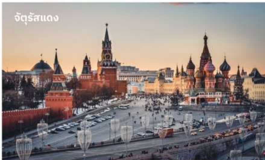
จัตุรัสแดง

บริการอาหารกลางวัน ณ ภัตตาคาร จากนั้นนำท่านเดินทางสู่ จัตุรัสแดง คำว่าสีแดงในความหมายรัสเซีย คือสิ่งสวยงาม มีลักษณะเป็นลานกว้าง และเป็นเวทีของเหตุการณ์สำคัญใน ประวัติศาสตร์ของรัสเซีย