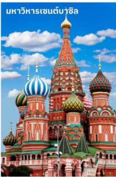
มหาวิหารเซนต์บาซิล

นำท่านถ่ายรูปด้านหน้า มหาวิหารเซนต์บาซิล สร้างในสมัยพระเจ้าอิวานที่ 4 จอมโหด ศิลปะเป็น แบบรัสเซียโบราณ ประกอบด้วยยอดโดม 9 ยอด เพื่อเป็นอนุสรณ์มีชัยชนะในสงคราม ที่มีชัยเหนือพวกมองโกลอย่างเด็ดขาด