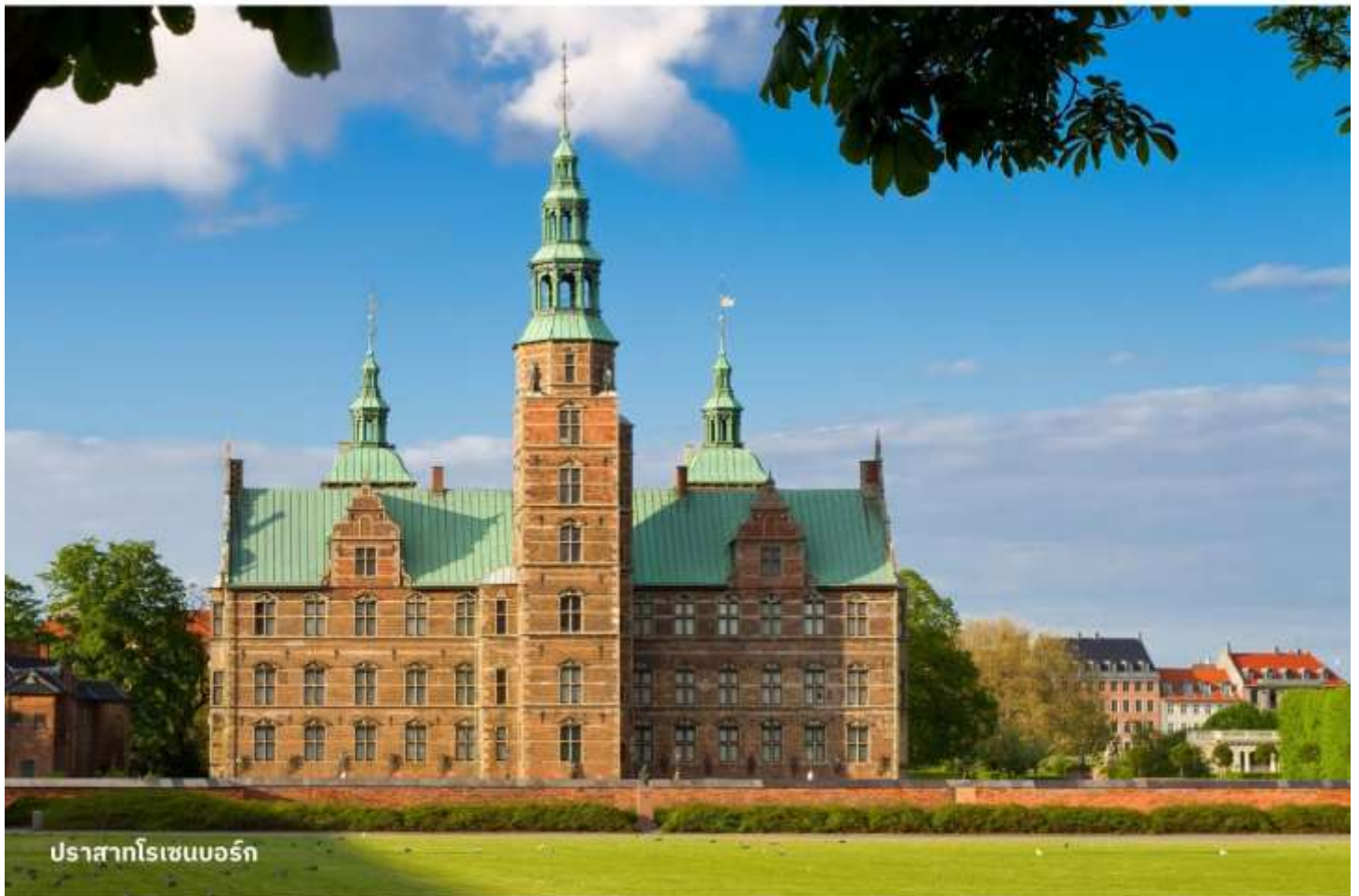
ปราสาทโรเซนบอร์ก

จากนั้นนำท่านเข้าชม ปราสาทโรเซนบอร์ก พระราชวังฤดูร้อนใจกลางเมืองโคเปนเฮเก้น เป็นพระราชวังที่มีอายุเก่าแก่กว่า 400 ปี โดยสถาปัตยกรรมของพระราชวังโรเซนเบิร์กนั้นได้รับอิทธิพลมาจากสถาปัตยกรรมรูปแบบเรอเนสซองส์ ซึ่งไฮไลท์สำคัญในการเข้าชมคือการชมเครื่องราชกกุธภัณฑ์ (The Crown Jewels) ของราชวงศ์เดนมาร์ก ซึ่งเป็นสมบัติล้ำค่าที่สุดที่จัดแสดงอยู่ที่นี้