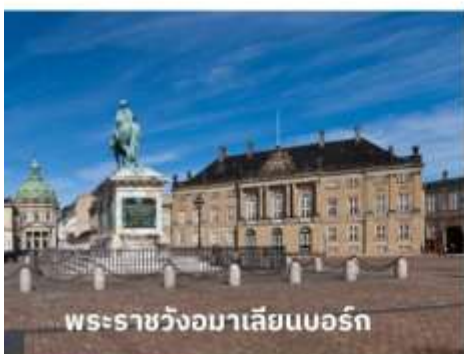
พระราชวังมาเลเซียนบอร์ก