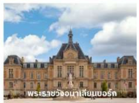
พระราชวังมาเลเซียนบอร์ก