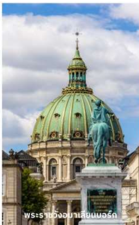
พระราชวังมาเลเซียนบอร์ก