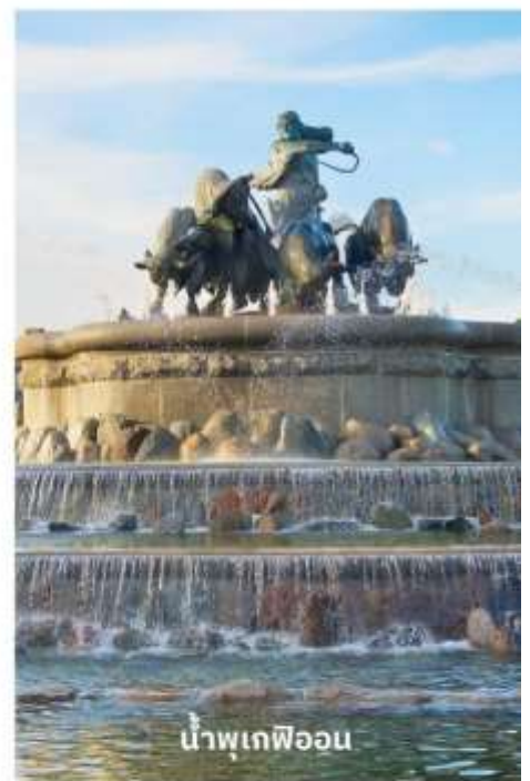
น้ำพุเทพีออน