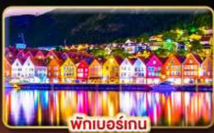
พักเบอร์เกน