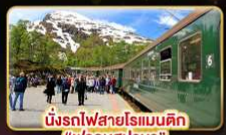
นั่งรถไฟสายโรแมนติก “ฟรอมสปานา”