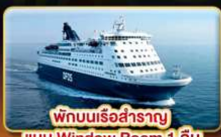
พักบนเรือสำราญ แบบ Window Room 1 คืน