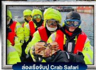
ล่องเรือจับปู Crab Safari