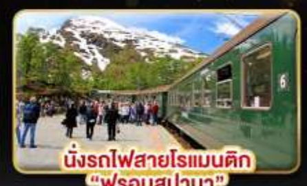
นั่งรถไฟสายโรแมนติก “ฟรอมสปาน่า”