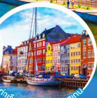
ท่าเรืออวอน.โคเปนเฮเกน

เดินทาง 18-27 มี.ค. 68 10-19, 11-20 เม.ย. 68 02-11, 16-25 พ.ค. 68