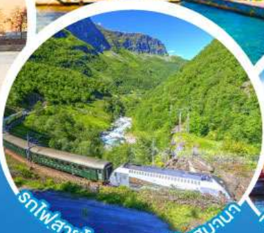
รถไฟสายโรแมนติกฟลินสบานา