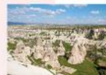
หุบเขาเทพเรนท์

** พักที่ Dedeli Cave Hotel 5* หรือเทียบเท่า **