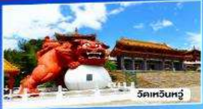
วัดเหยิ่นเหยี่ว

อาลีซาน ทะเลสาบสุริยันจันทรา จั๋วเฟิ่น 5วัน 3คืน