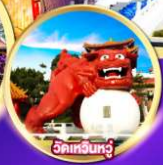
วัดเหวินหู่