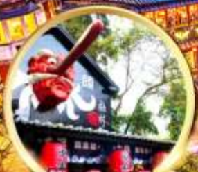
หมู่บ้านปี่ศาจชิวโกว