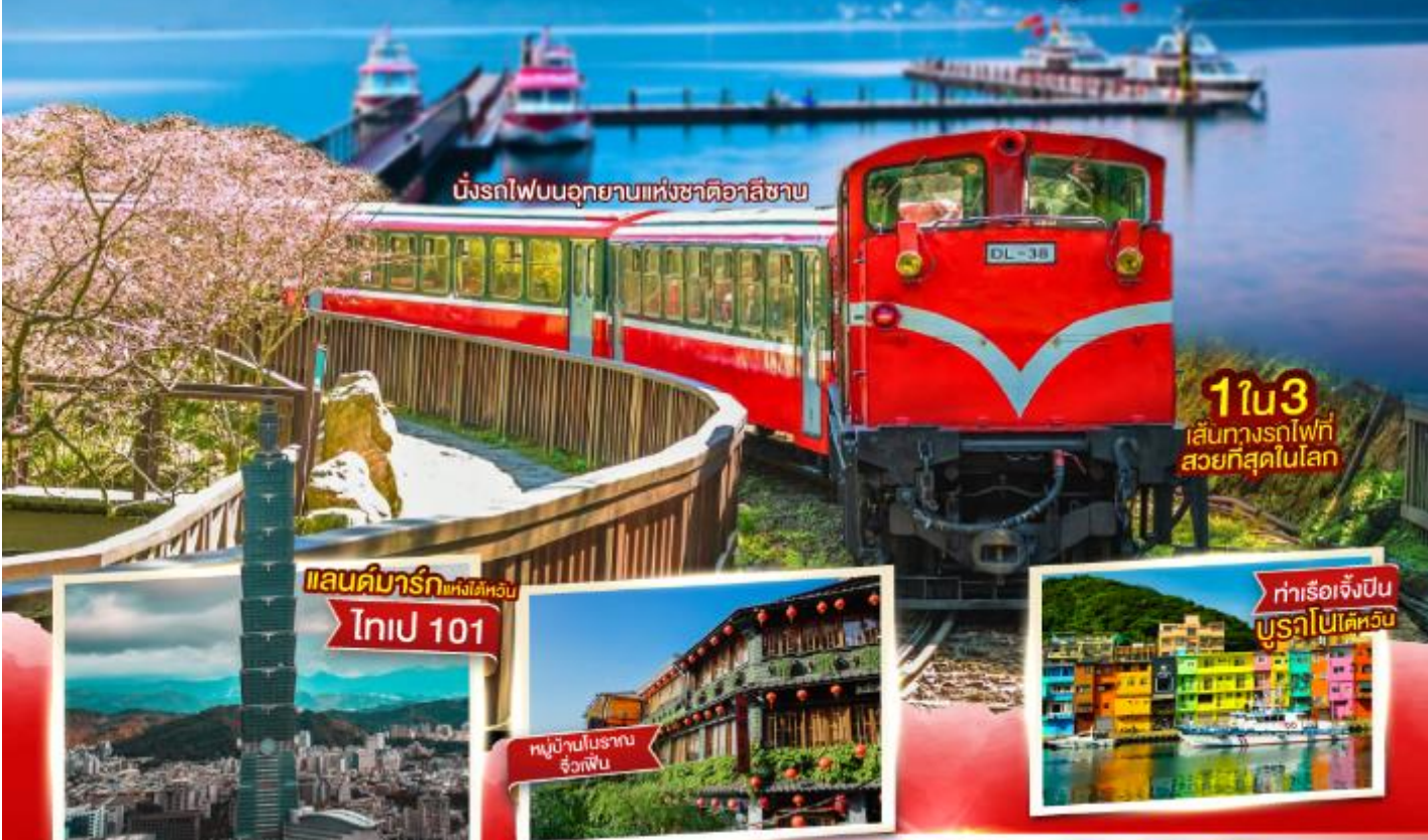
นั่งรถไฟบนอุทยานแห่งชาติอาลีซาน

ประกันอุบัติเหตุและอุบัติเหตุ คุ้มครองสูงสุด 3,000,000