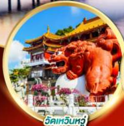
วัดเหวินหฺวู่