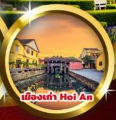
เมืองเก่า Hoi An