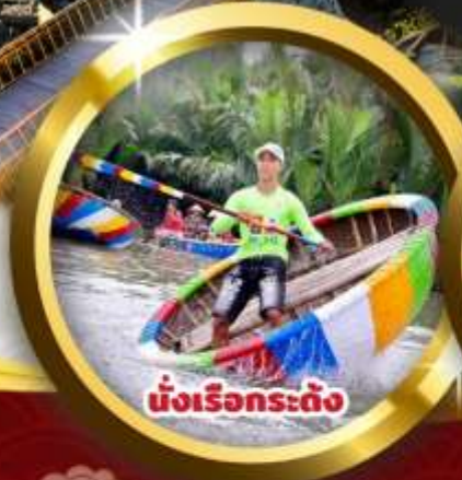
นั่งเรือกระดิ่ง