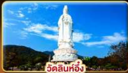
วัดลินห์ฮิ่ง