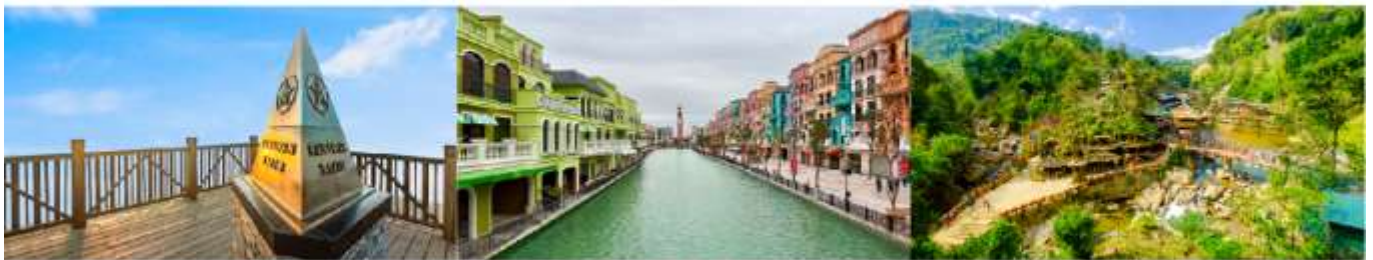
ยอดเขาฟ่านซีบิ่น