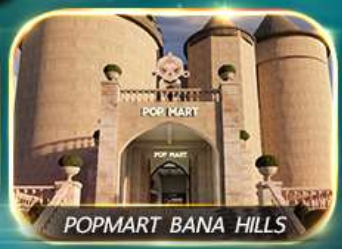
POPMART BANA HILLS

สัมผัสความงามหมู่บ้านฝรั่งเศสที่บานาฮิลล์ ช้อปปิ้ง POPMART