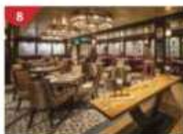
Bistro By Mark Best Relish contemporary Western cuisine from the internationally-acclaimed Australian chef.