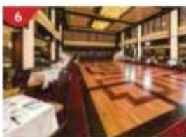
Dream Dining Room Savour a wide variety of Asian and international cuisine.