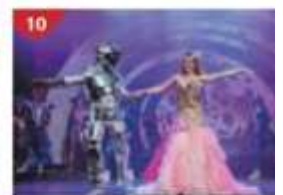
Zodiac Theatre Enjoy live production shows from the acclaimed award-winning entertainment team.