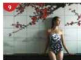
Crystal Life™ Spa Rejuvenate mind, body and soul with our holistic Western and Asian spa experience.