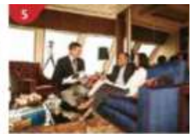
The Palace Indulge in European-style butler service and exclusive facilities.