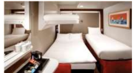
พัก 3-4 ท่าน