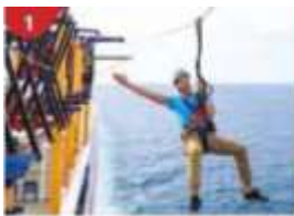
Ropes Course & Zipline Feel the thrill of gliding above the ocean on a 35-metre zipline.