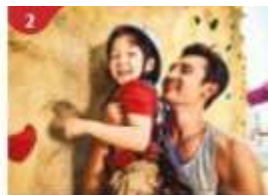
Rock Climbing Wall Challenge yourself on our mountainous rock climbing wall.