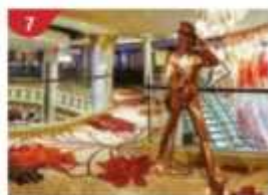
Johnnie Walker House™ Immerse yourself in the intricate world of premium Scotch whisky.